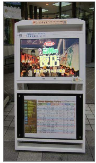
※ 下部にA3チラシを掲載